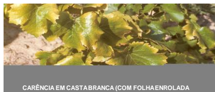
CARÊNCIA EM CASTABRANCA (COM FOLHA ENROLADA)